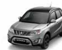
Galactic Gray Metallic/ Cosmic Black Pearl Metallic (A9G)