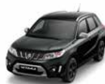
Cosmic Black Pearl Metallic (ZCE)