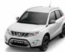
Cool White Pearl Metallic (ZNL)