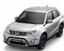
Silky Silver Metallic (ZCC)