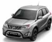
Galactic Gray Metallic (ZCD)