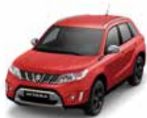
Bright Red (ZCF)