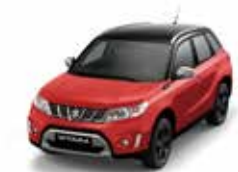
Bright Red/ Cosmic Black Pearl Metallic (A9H)3